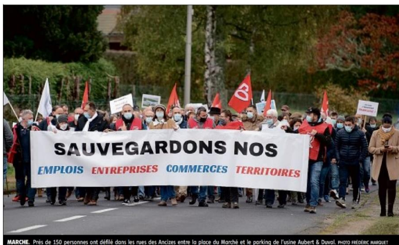
MARCHE. Près de 150 personnes ont défilé dans les rues des Ancizes entre la place du Marché et le parking de l'usine Aubert & Duval.

Elle s'est terminée par une prise de parole des représentants syndicaux, suivi du maire des Ancizes et de Mme la Députée PIRES-BEAUNE très engagée pour défendre au nom de tous les élus locaux la survie de l' entreprise.